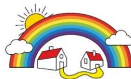
Nachbarschaftshilfe Wörth/Hörlkofen e.V.

Das Angebot der Nachbarschaftshilfe ist für alle gedacht, die wegen Erkrankung oder anderer Belastung schnelle und unbürokratische Hilfe im Haushalt, bei der Betreuung von Kindern oder Senioren brauchen.