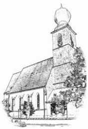
St. Andreas (St.A.)