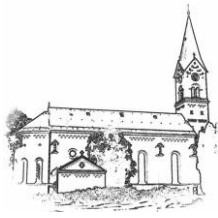
St. Nikolaus (St.N.)