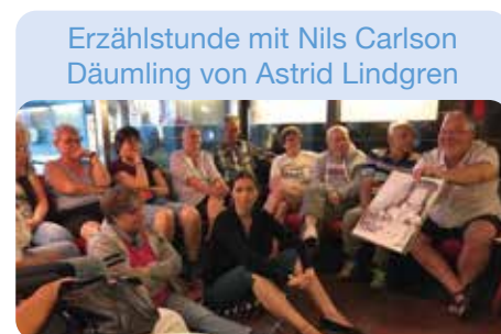
Erzählstunde mit Nils Carlson Däumling von Astrid Lindgren