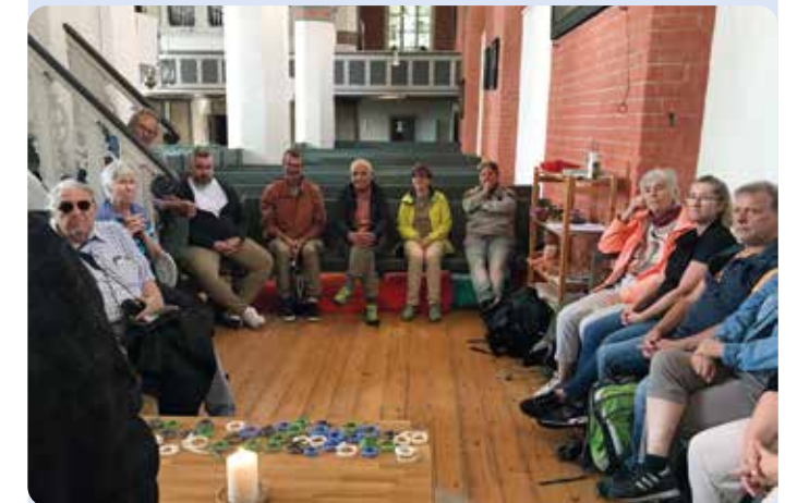
Anreise umweltfreundlich mit der Bahn nach Stralsund. In der Hl. Geist-Kirche Gottesdienst und erstes Kennen- lernen. Weiter ging's mit der Fähre nach Trelleborg und zum Hotelin Malmö