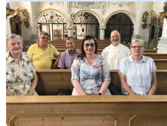
Endlich wieder zum Gottesdienst und plaudern in der Stiftung Ecksberg Bei strahlendem Sonnenschein trafen sich Gehörlose aus dem Mühldorfer Verein am 19.Juni.