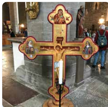
Besuch in Vadstena bei der Hl. Birgitta