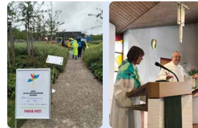
Gummistiefel-Wetter auch bei der Landesgartenschau am 7.Juli.