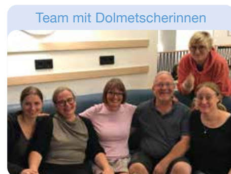
Team mit Dolmetscherinnen