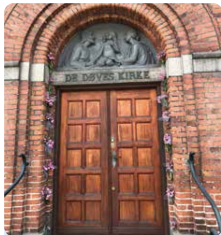
Kopenhagen: Zu Gast in der Gehörlosenkirche