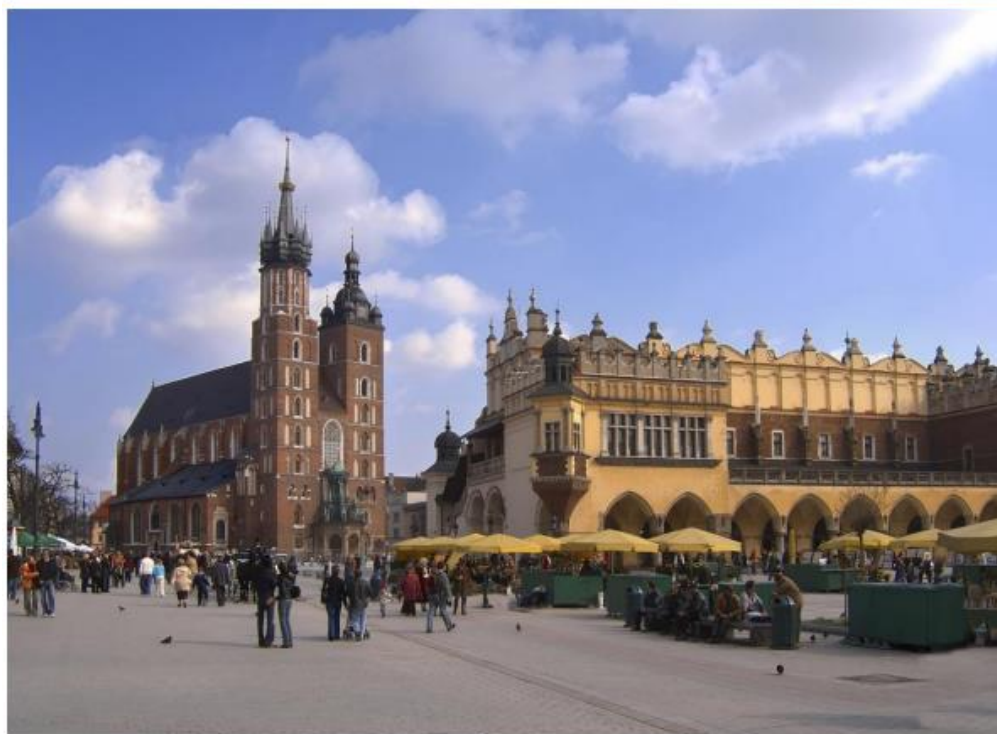
Marktplatz in Krakau mit Marienkirche