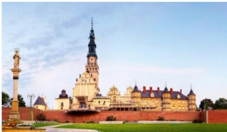
Heiligtum Jasna Gora in Tschenstochau

Führung durch das Heiligtum mit Kapelle und neuer Basilika. Feier einer hl. Messe. Am Nachmittag Besuch des Salzbergwerks in Wieliczka. Es ist eines der ältesten und bekanntesten Salzbergwerke der Welt. 135 Meter unter Tage können hier über 20 faszinierende Salzkammern entdeckt werden. Rückkehr ins Hotel und Abendessen.