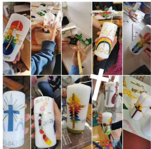
Osterkerzenbasteln der Kinder in Großweil und Ohlstadt