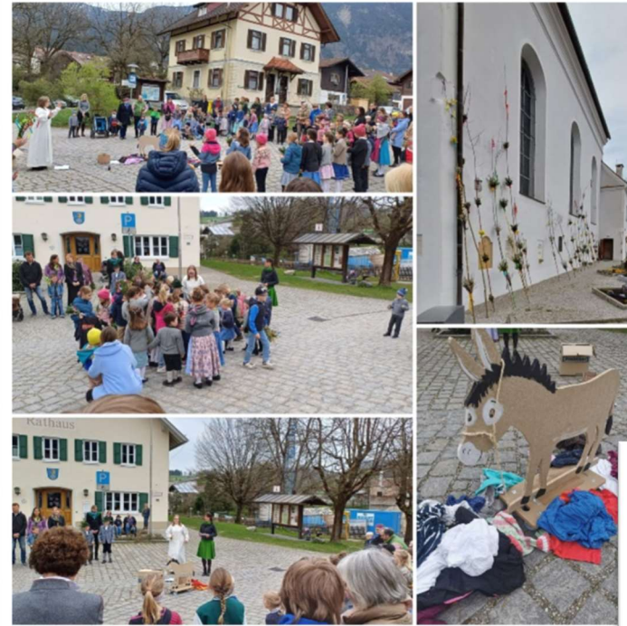
Im Kindergottes- dienst am Palm- sonntag dürfen die Kinder gemeinsam den Einzug Jesu in Jerusalem feiern.