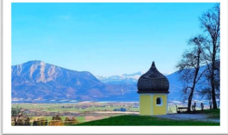
Wanderung Übern Horizont: Elf Frauen waren in Stationen vom Stern zur Hofkapelle Witting unterwegs.