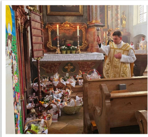
Speisenweihe im Auferstehungsgottesdienst am Ostermorgen.