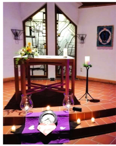
Innehalten in der Kolpingkapelle: Wofür nehme ich mir wirklich Zeit? Was ist meine HerzensZEIT?