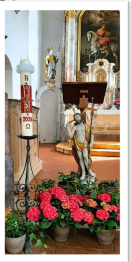
Ostern in der Kirche St. Martin in Zell.