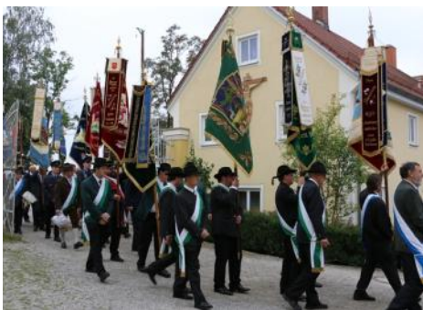
Einzug der Fahnenabordnungen 2015