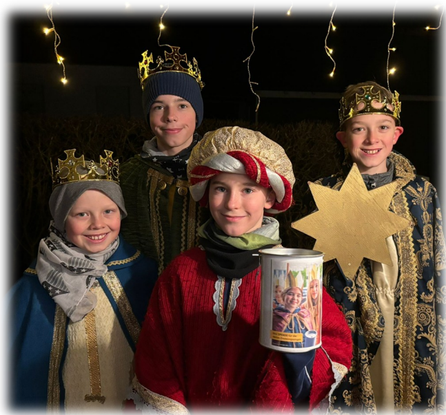
Gilchinger Sternsinger 2024

Mitmachen können alle Kinder ab 8 Jahren.