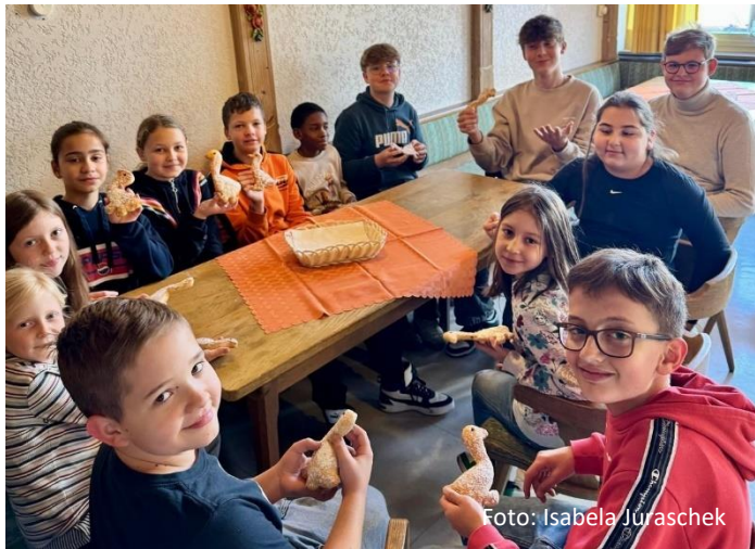
Ministranten bei der Kostprobe der Gänse für den Martinimarkt