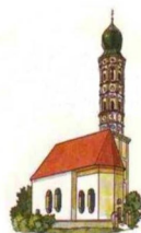
St. Kastulus Puchschlag

Anschließend gemütliches Beisammensein am Kirchplatz mit Brotzeit und warmen Getränken