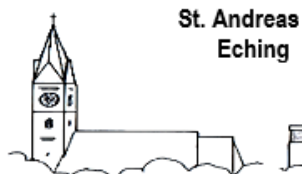
St. Andreas Eching