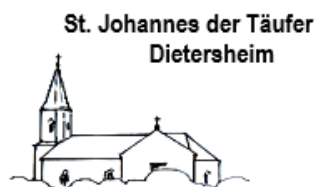
St. Johannes der Täufer Dietersheim

Kirchenanzeiger der katholischen Pfarrei St. Andreas – Eching mit Filiale St. Johannes der Täufer - Dietersheim