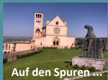
Auf den Spuren ...