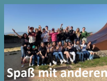
Spaß mit anderen