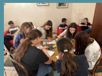
Themen der Firmung