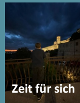
Zeit für sich