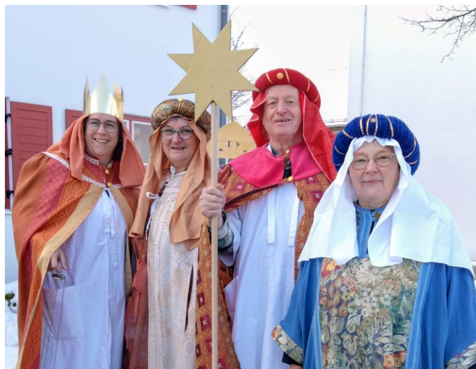
Gruppe, die den Kindergarten besuchte