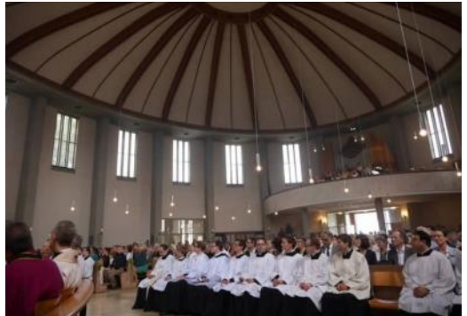
Fronleichnamskirche München bei meiner Primiz 2015

In der Prozession kommt das alttestamentliche Motiv von Gott zum Ausdruck, der