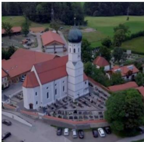
St. Emmeram in Kleinhelfendorf

Von dort spazieren wir nach St. Nikolaus zur Besichtigung und einer kurzen Osterandacht. Im Anschluss wandern wir weiter nach Kleinhelfendorf ca. 47 min (3,3 km).