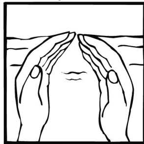
Taufe: Von Gott angenommen