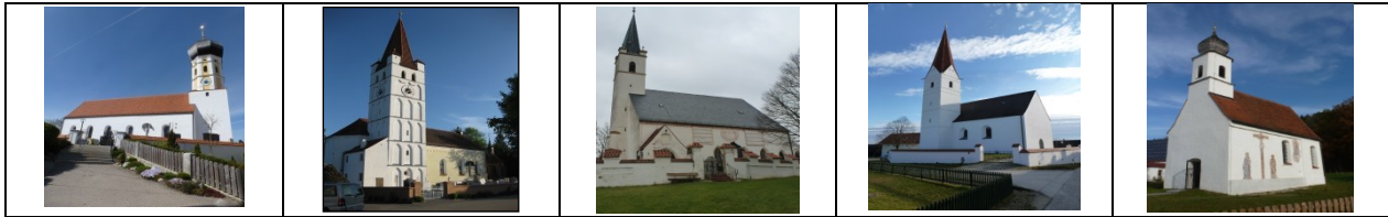
St. Martin Bergen

Berichte und Informationen – Dezember 2025