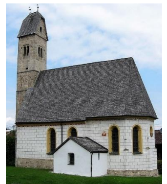
St. Maria Geburt Esterndorf