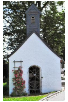
St. F. Xaver Großseeham