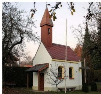
St. Maria-Magdalena Kreuzstraße