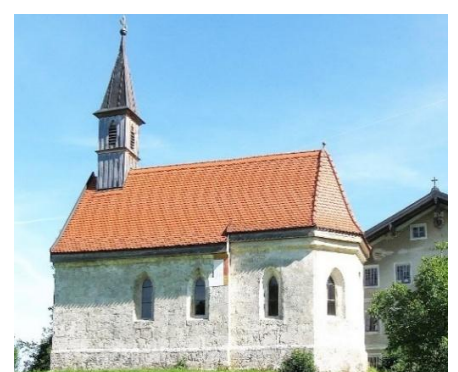
St. Vitus Mittenkirchen