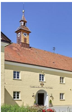
St. Franz Xaver Valley