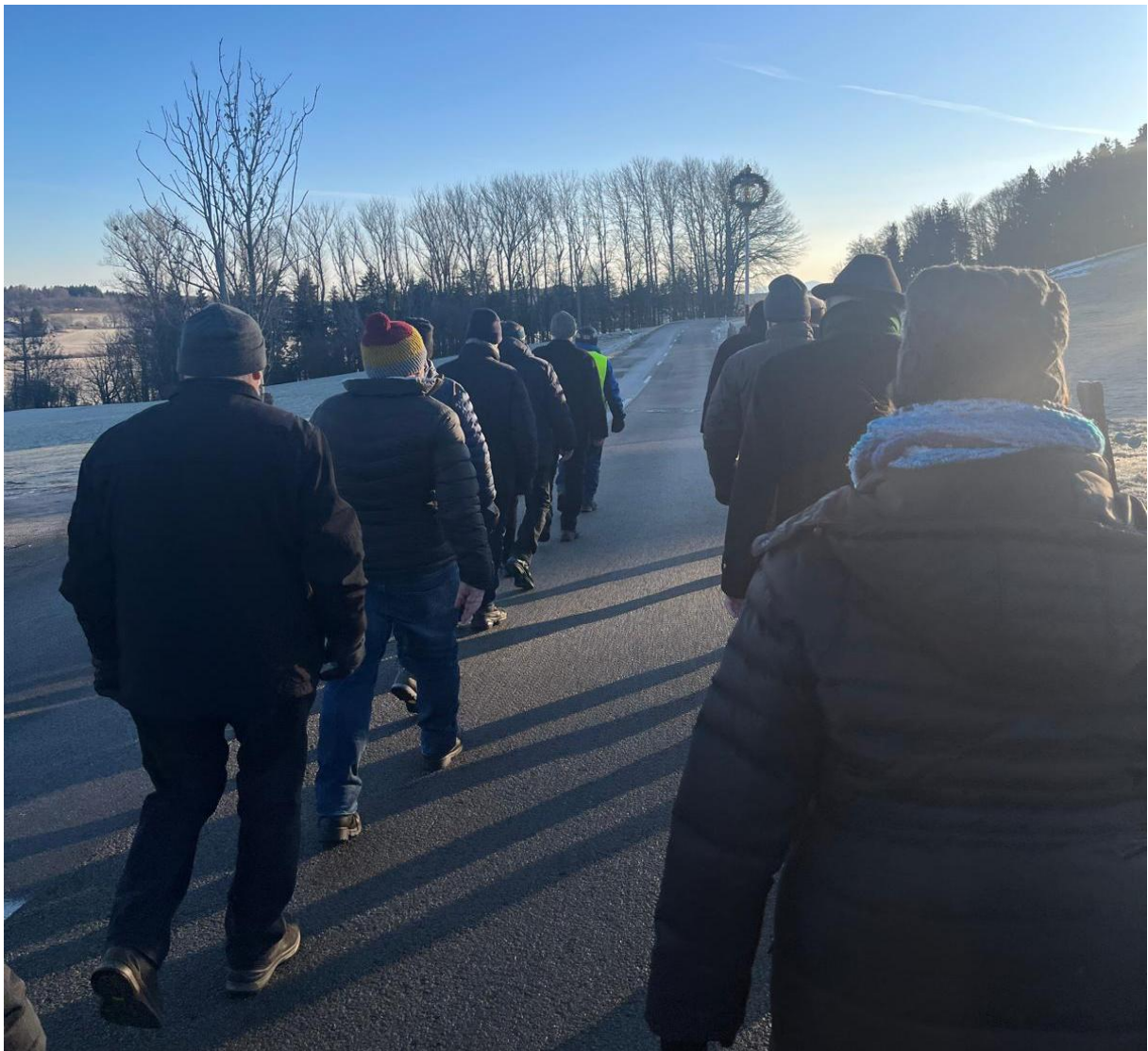
Sebastianibittgang am 20.01.2026 von Wattersdorf nach Holzolling

hier die weiteren Termine für das 1. Halbjahr 2026: 08.04. / 06.05. / 10.06.