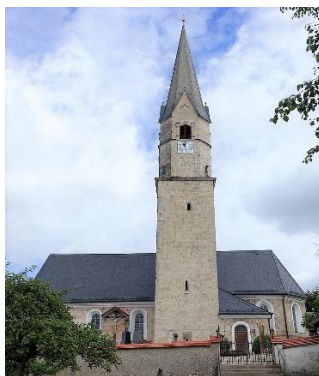
St. Georg Kleinpienzenu