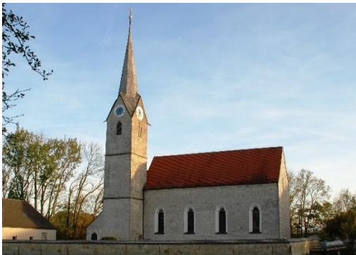
St. Andreas Hohendilching