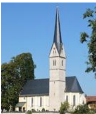
St. Leonhard Reichersdorf