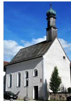
St. Maria-Hilf Weyarn