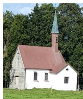
St. Gegeiß. Heiland Ramsenthal