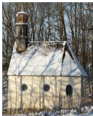
St Leonhard Weyarn