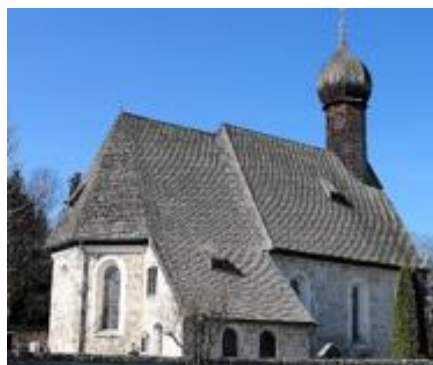
St. Jakobus Gotzing