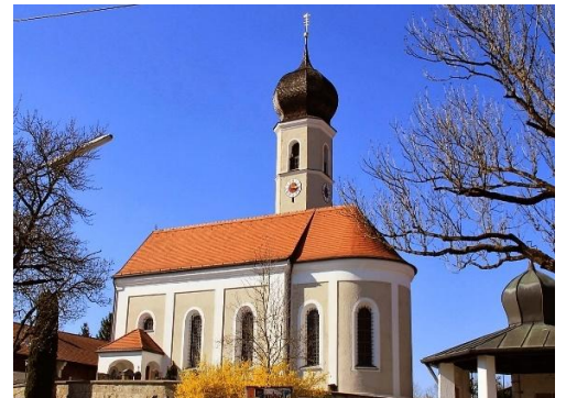
St. Maria Heimsuchung Kleinhöhenkirchen