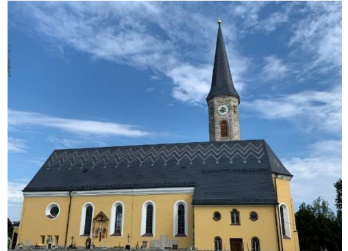
St. Dionysius Neukirchen