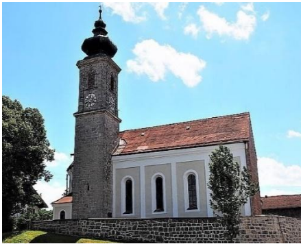
St. Johannes Baptist Unterdarching