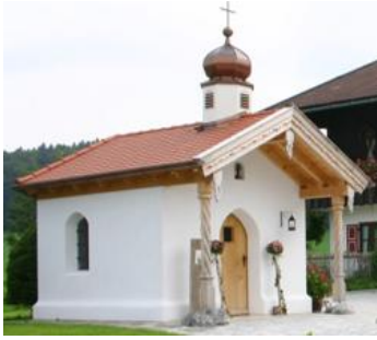
St. Josef Reichersdorf