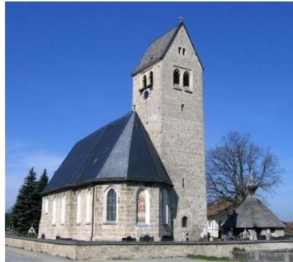
St. Michael Oberdarching