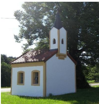
Heilige Drei Könige Fentbach