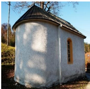
St. Kreuzerhöhung Aumühle