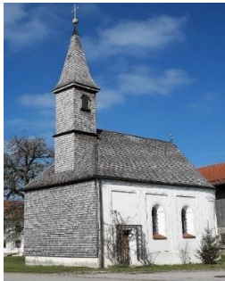
St. Maria Schmerzen Sollach