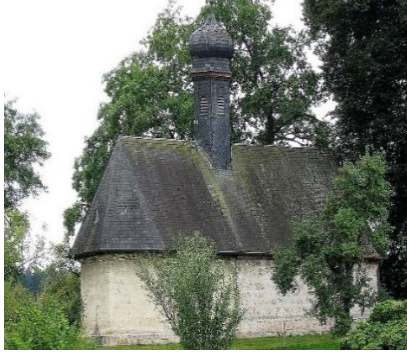
St. Michael Sonderdilching