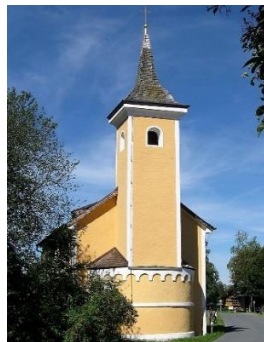
St. Rupert Bruck