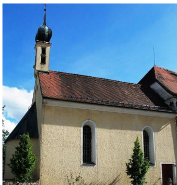
St. Jakobus Weyarn