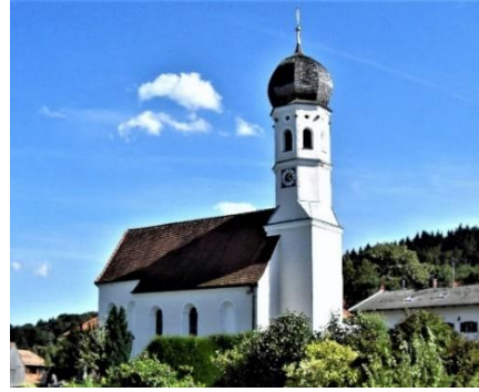
St. Martin Holzolling