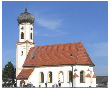
St. Korbinian Oberlaindern