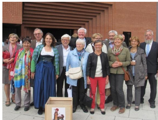
Photo des 2 commissions, en 2016, devant la cathédrale d'Évry.

2021 Conférence, en ligne, franco-allemande sur la coexistence interreligieuse, à l'occasion de la Journée missionnaire mondiale (Allemagne-France-Sénégal)