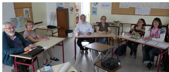
Echange des 2 groupes partenaires dans une salle paroissiale Saint-Clément à Arpajon / France