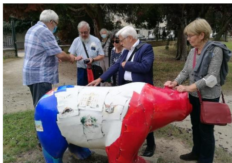
Echanges près de l'ours de St Corbinien, à Arpajon, France.